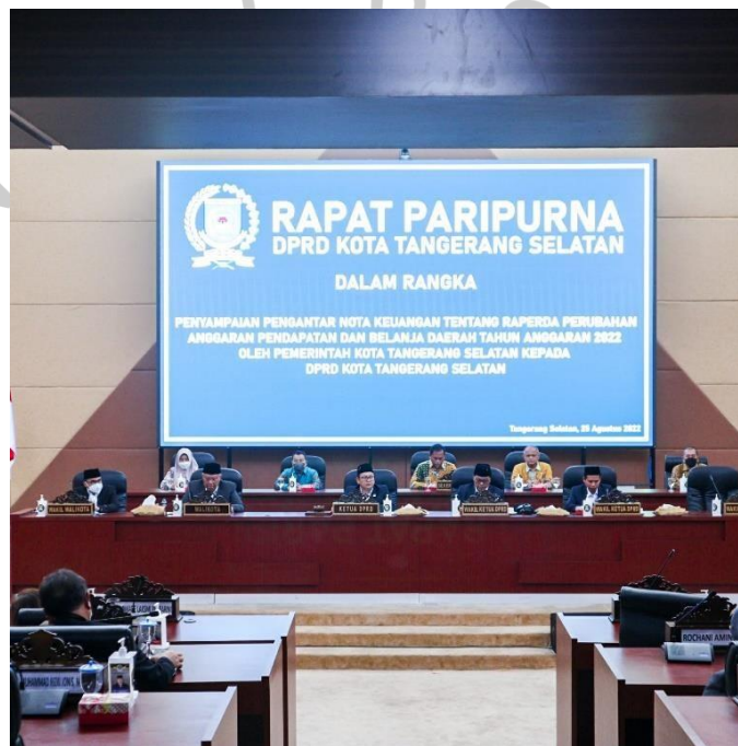
Gambar 2 3 Gambar Rapat Paripurna DPRD Tangerang Selatan

Sekretariat DPRD Kota Tangerang Selatan melakukan Perjalanan dinas pada hari Selasa, Rabu dan Jum'at lalu pada hari Senin dan Kamis data anggaran turun berbentuk data yang akan di alokasikan untuk di input ke bagian Perencanaan Keuangan dan juga mengadakan beberapa kali rapat Paripurna dan rapat bersama DPRD kota lainnya.