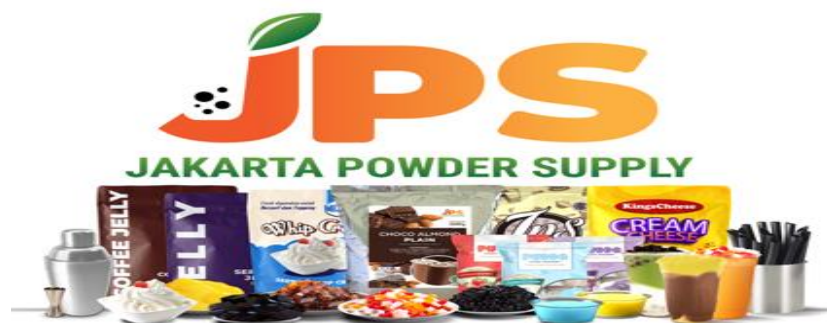
Gambar 2.2 Produk PT Bagusfood Indonesia Hebat

Produk yang dijual oleh PT Bagusfood Indonesia Hebat dapat dibeli di e-commerce seperti Shopee dan Tokopedia. Selain itu, dijual di e-commerce, PT Bagusfood Indonesia Hebat juga melayani pembelian secara langsung dengan datang ke kantor.