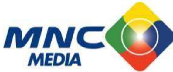
Gambar 2. 2 Logo MNC Media