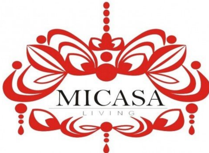
Gambar 2.1 Logo Perusahaan

Sejak 2010 hingga sekarang dengan pengalaman lebih dari 10 tahun, Micasa Living berusaha mewujudkan impian setiap klien sebagai mitra terpercaya. Micasa Living telah merancang dan membangun lebih dari 100 proyek, mulai dari proyek perumahan, kantor, ruang publik, dan ritel.