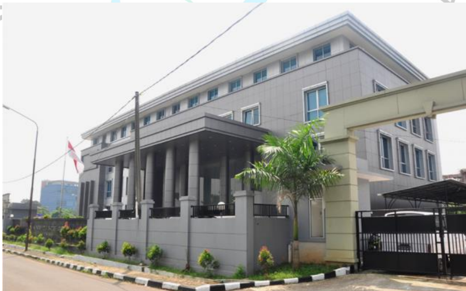
Gambar 1. 1 Kantor Kejaksaan Negeri Jakarta Selatan