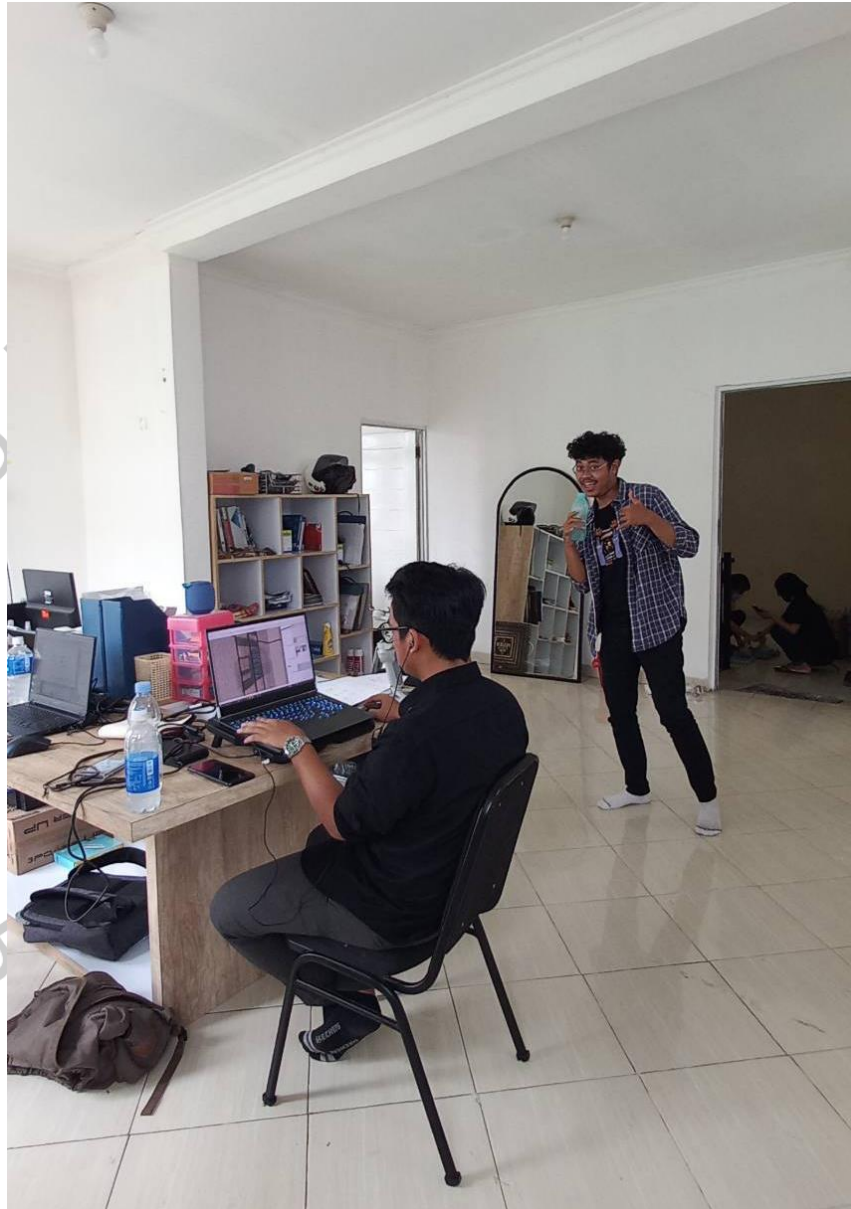
Gambar 2. 1 Kondisi Dalam Kantor

Lokasi kantor Shiraz Design , terletak di Jl. H. Aba, Panunggan Utara, Kec. Pinang, Kota Tangerang, Masuk kedalam wilayah Alam Sutera, kantor terletak di perumahan warga tepatnya di dalam ruko.