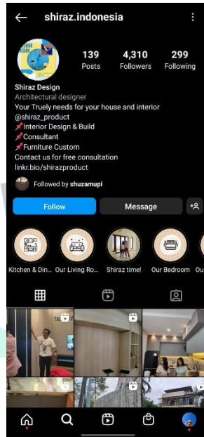
Gambar 2. 3 Media Sosial (Instagram/shiraz.indonesia)

jaringan atau mempromosikan hasil karyanya, Shiraz Design dengan menggunakan media sosial Instagram yang berbeda sesuai dengan