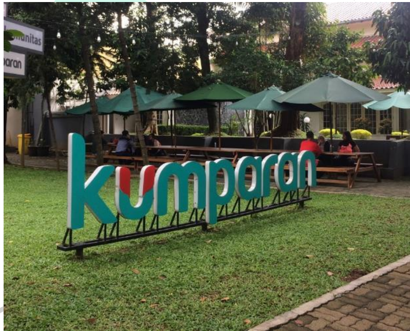
Gambar 2. 2 Kantor PT Dynamo Media Network (Kumparan)

Selain itu, Kumparan telah meraih banyak penghargaan setelah merintis sebagai startup digital selama 5 tahun dimulai dari penghargaan nasional hingga mancanegara seperti Youtube Innovation Fund (2018), Best Digital News Startup WANIFRA (2019), Most Favorite Publisher Line Awards (2019), Google Initiative Fund (2020), Best in Audience Engagement WANIFRA (2020), Best Digital Marketing Campaign for News Brand WANIFRA (2020), Best Revenue Diversification Project WANIFRA (2022), Best Feature in Photography WANIFRA (2022), dan Best in Sport Photography (2022)