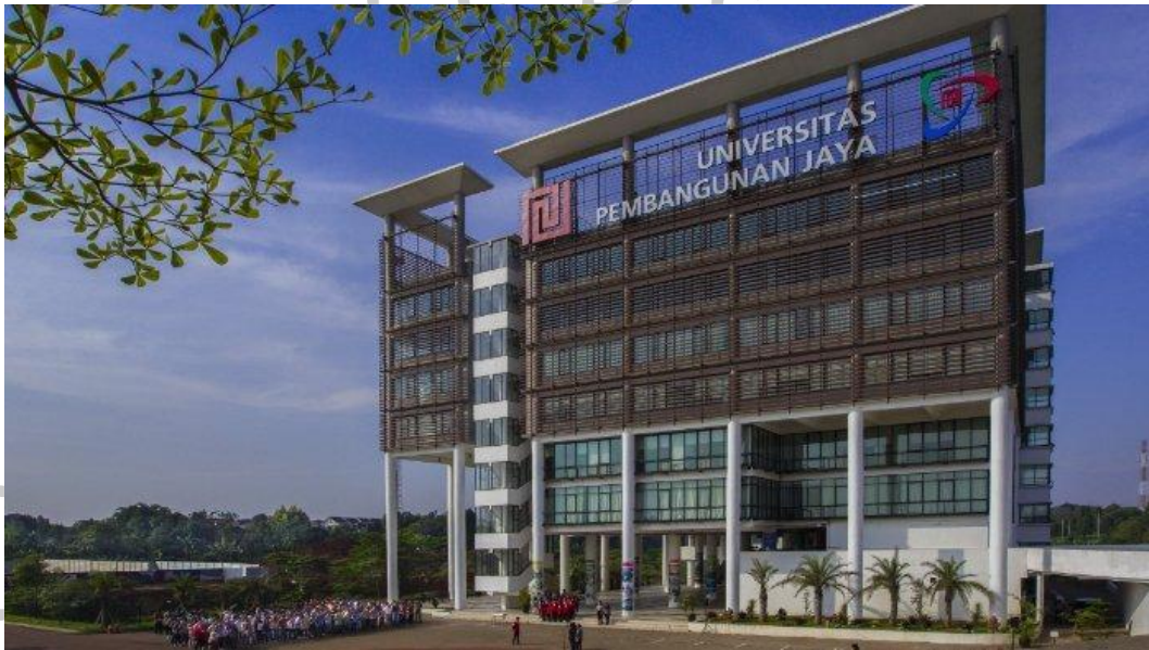
Gambar 2.1 Universitas Pembangunan Jaya

Universitas Pembangunan Jaya (UPJ) merupakan universitas swasta yang berdiri di daerah Bintaro sejak tahun 2011. UPJ didukung oleh beberapa kelompok usaha Pembangunan Jaya. Kelompok usaha tersebut memiliki 17 usaha yang bergerak di beberapa bidang tertentu. Yayasan Pendidikan Jaya sejak 3 September 1991. Yayasan tersebut memiliki tujuan untuk memberikan sebagian dari kegiatan usaha induknya demi melahirkan sumber daya manusia tanah air yang berkualitas.