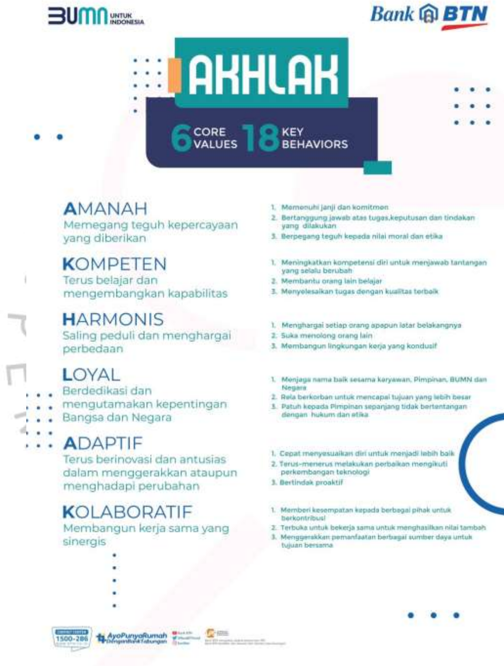
Gambar 2.1 Nilai-nilai AKHLAK