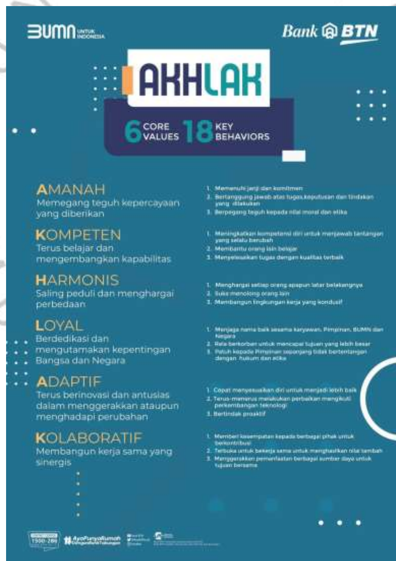
Gambar 2.2 Nilai-nilai AKHLAK Sumber : Bank BTN Kantor Cabang Bintaro Jaya