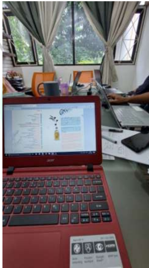
Gambar 2. 2 Ruang Rapat Kantor

Perusahaan menggunakan apartemen yang dijadikan tempat operasional PT. Mahesa Energi Persada. Apartemen Taman Rasuna Berlokasi di kawasan Menteng Atas, Setiabudi. Alasan memilih lokasi tersebut dikarenakan tempat ini sangat strategis dalam melaksanakan operasional perusahaan. Perusahaan berada di lantai 1 pada unit 01 LGC.