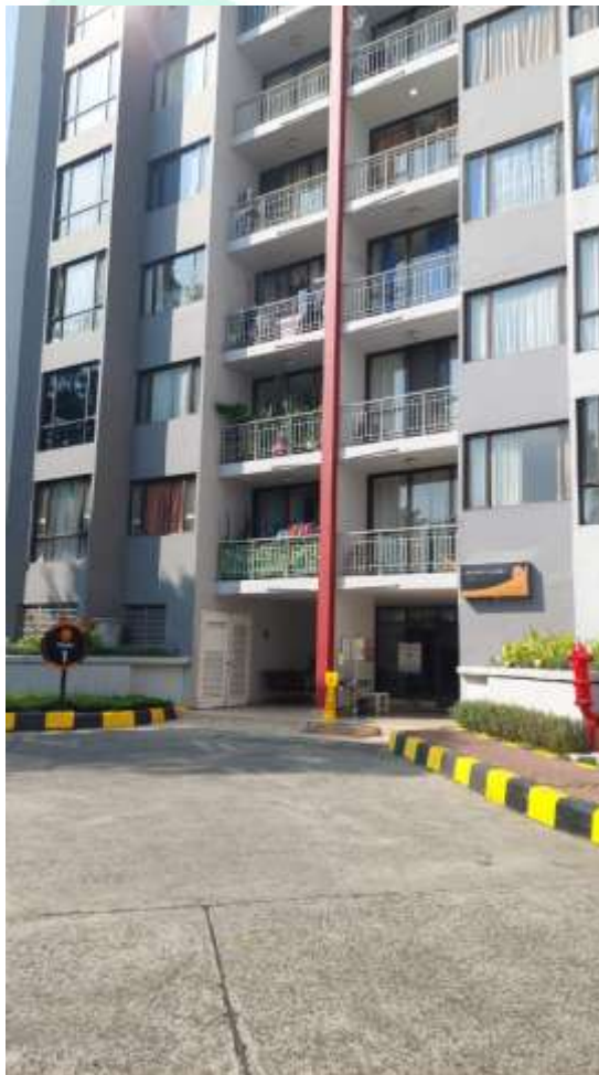
Gambar 2. 1 Tempat Perusahaan

PT Mahesa Energi Persada berdiri pada tahun 2018. Perusahaan ini pertama kali berdiri di alamat Jl. Maluku A No.100, Pd. Pucung, Kec. Pd. Aren, Kota Tangerang Selatan, Banten, yang dimana kantornya berada dirumah. Pada tahun 2019 perusahaan PT. Mahesa Energi Persada pindah ke Apartemen yang berada di daerah Apartemen Taman Rasuna, Tower 1 Unit LGC. Jl. HR Rasuna Said. Jakarta Selatan.