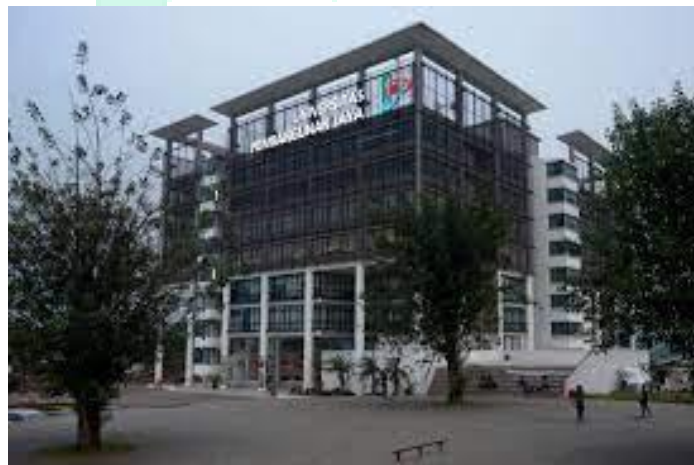
Gambar 2. 1 Gedung UPJ

Universitas Pembangunan Jaya (UPJ) merupakan perguruan tinggi swasta di daerah Bintaro yang didirikan pada tahun 2011 melalui dukungan dari kelompok usaha Pembangunan Jaya. Kelompok usaha Pembangunan Jaya didalamnya terdapat 17 usaha yang bergerak dibidang properti, pabrik, konsultan manajemen dan desain, kontraktor, pariwisata/rekreasi, trading, mekanikal & elektrikal serta ilmu pengetahuan.