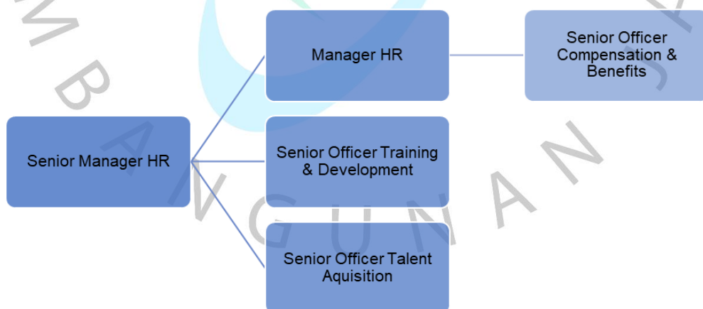
Gambar 2. 4 Struktur organisasi Human Resource Departement PT. AEON Indonesia

Pada struktur organisasi Human Resource Departement PT. AEON Indonesia, posisi Senior Manager HR adalah jabatan tertinggi yang memimpin beberapa posisi dibawahnya yaitu Manager HR , Senior Officer