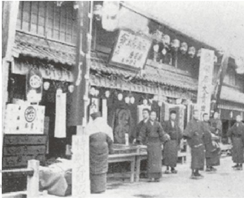
Gambar 2. 2 Toko Pertama di Kyuroku-Machi, Yokkaichi

Tsuji dilihat sebagai tempat yang memiliki potensi perkembangan yang baik, namun terjadi banyak perlawanan dari pihak pekerja dan dari pihak keluarga. Mereka melihat dengan mata mereka sendiri usaha toko Okada yang sudah sangat sukses di Kruyoku-machi, maka dari itu mereka tidak mendukung perpindahan toko ke Tsuji. Pada masa itu, tercetuslah sebuah kalimat yang menjadi motto AEON sampai saat ini yaitu "Give Wheels to the Central Pillar" yang artinya melekatkan roda pada pilar utama. Pilar utama dapat diartikan sebagai fondasi bisnis, jika pilar tersebut sudah kuat maka perpindahan kemanapun maka akan tetap kuat. Kita harus menerima perubahan yang terjadi dengan tetap memegang teguh nilai-nilai yang menjadi pilar utama kita.