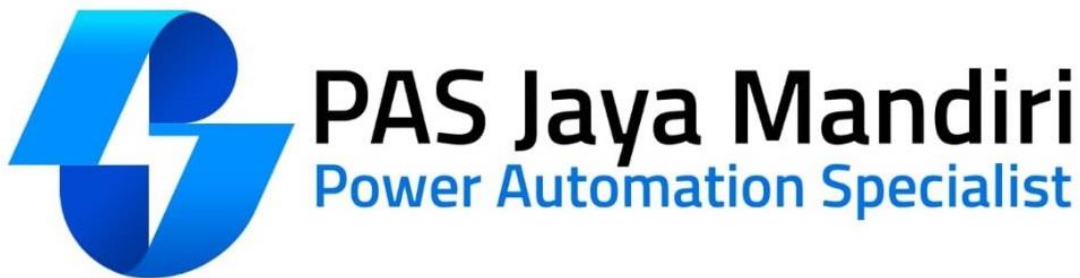
Gambar 2. 1 Logo PAS JAYA MANDIRI