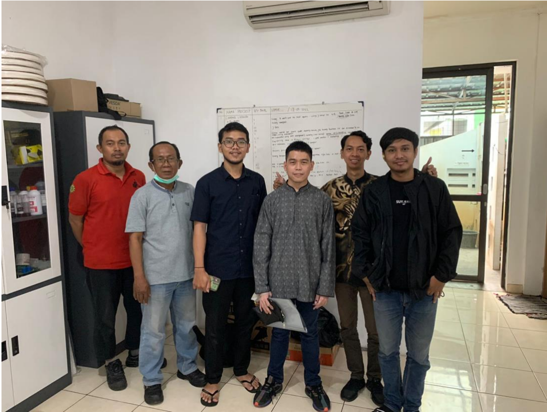
Lampiran B-5 Foto Bersama dengan Pengawas Gudang dan Karyawan Lainnya di Gudang 1