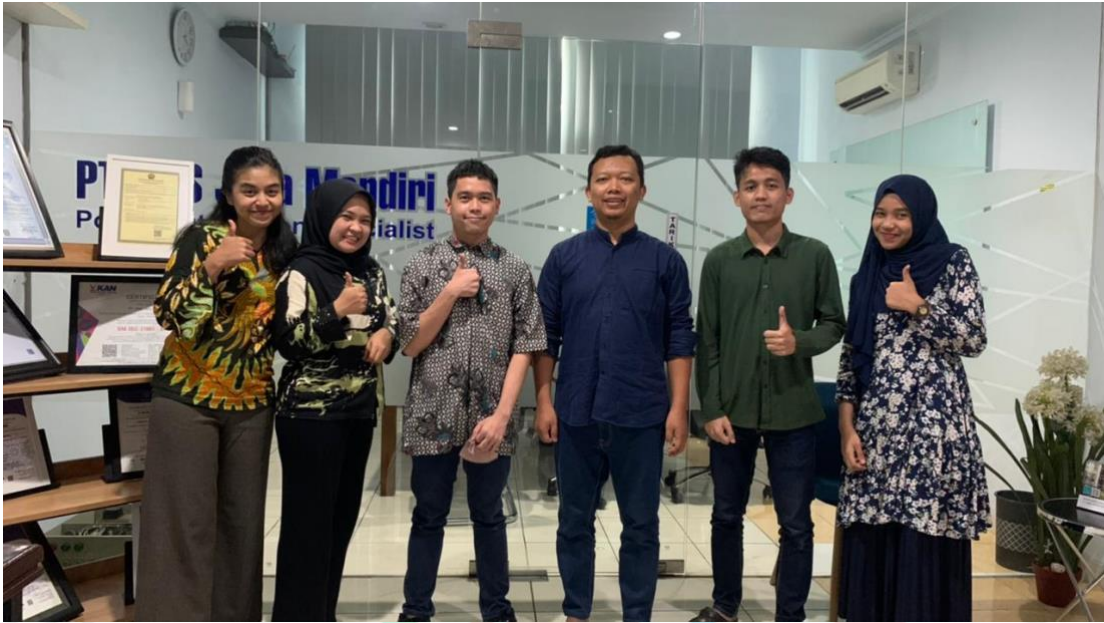
Lampiran B-1 Foto Bersama dengan Pembimbing Kerja, Direktur dan Karyawan lainnya di Kantor Utama