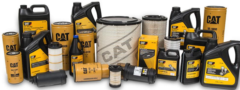
Gambar 2 5 Produk Yang Ditawarkan PT Perkasa Teknik Mandiri

Setiap jasa-jasa yang diberikan oleh PT Perkasa Teknik Mandiri membutuhkan part atau barang penunjang untuk memperbaiki mesin milik customer yang rusak. Berikut beberapa spare part yang ditawarkan oleh PT Perkasa Teknik Mandiri untuk menunjang kegiatan operasional mereka :