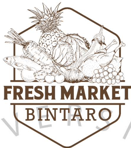
Gambar 2. 2 Logo Fresh Market Bintaro