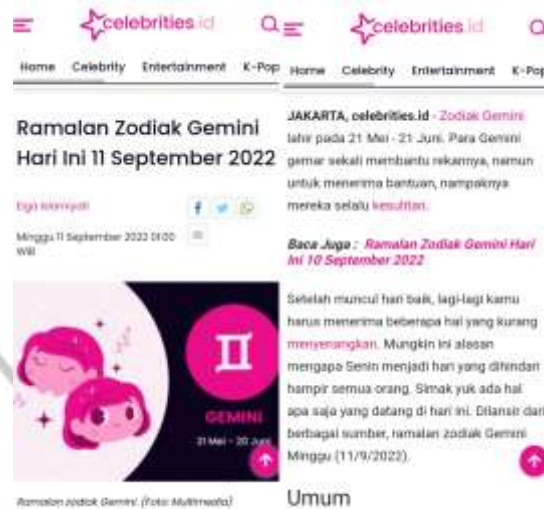
Gambar 3.3 Hasil Artikel Zodiak yang Publish di Celebrities.id