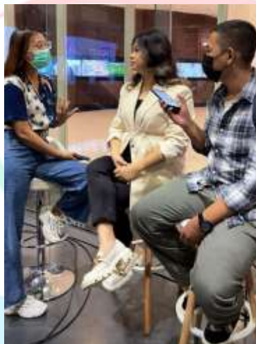
Gambar 3.4 Proses Liputan dan Wawancara

Sedangkan untuk liputan diluar lapangan, praktikan biasa melakukan liputan untuk program “Uang Kaget Lagi”, “Live Music Sarinah”, “Cahaya Hati”, dan program lainnya. Liputan lapangan biasa dilakukan pada hari senin, selasa, rabu, kamis, jumat, sabtu, minggu. Untuk liputan lapangan ini dilakukan satu minggu satu kali, namun liputan lapangan hanya dilakukan apabila ada jadwal syuting untuk program yang telah dijelaskan diatas. Untuk lokasi liputan lapangan sendiri berpindah-pindah menyesuaikan dengan lokasi syuting. Dalam proses peliputan, nantinya liputan akan meliput bersama dengan satu reporter dan satu hingga dua anak praktek kerja lainnya. praktikan akan mengikuti seluruh kegiatan syuting tersebut. Pada tahap ini, proses wawancara dilakukan bersamaan dengan liputan. Proses wawancara biasanya dilakukan pada saat narasumber telah menyelesaikan proses syuting. Nantinya praktikan akan mengajukan beberapa pertanyaan dan merekam jawaban tersebut menggunakan voice note.