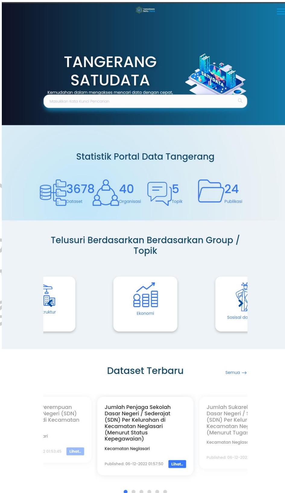
Gambar 2.6 Tangerang Satu Data Statistik Portal Data Kota Tangerang