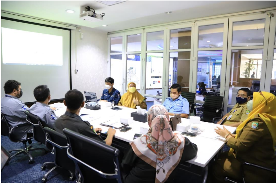
Gambar 2.5 Rapat Percepatan Tangerang Satu Peta