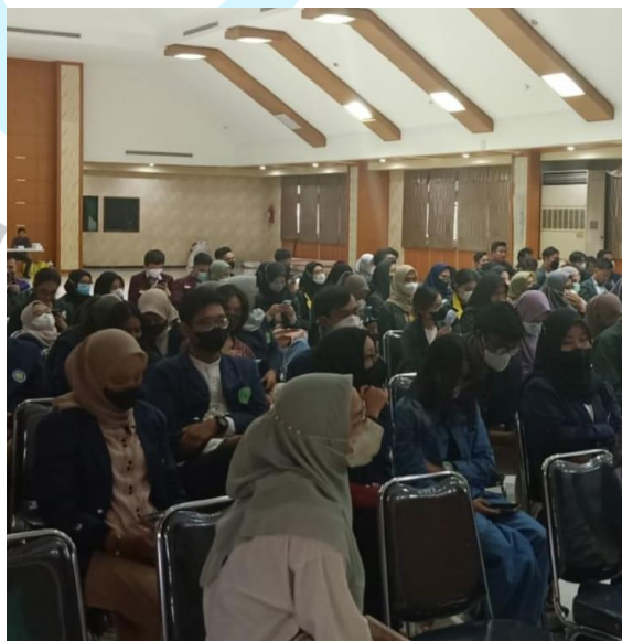
Gambar 2.8 Kegiatan Sosialisasi Aplikasi Tangerang Live