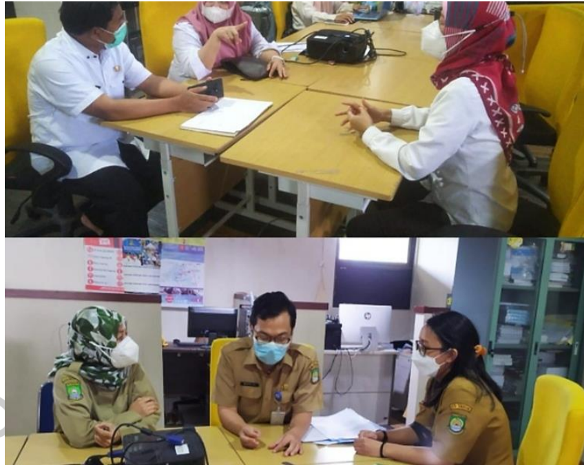
Gambar 2.7 Rapat Satu Data Kota Tangerang