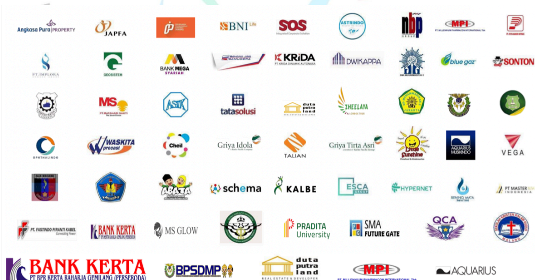
Gambar 2. 2 Rekan Kerja dan Klien Sekardiu Consulting

Rekan kerja dan klien yang telah melakukan kerja sama dengan Sekardiu Consulting terdapat lebih dari 20 perusahaan yang berasal dari berbagai bidang sejak tahun 2013. Perusahaan yang bekerjasama dengan Sekardiu Consulting berasal dari perusahaan lokal dan nasional dalam beragam jenis industri. Tidak hanya perusahaan, Sekardiu Consulting juga bekerja sama dengan sejumlah instansi pendidikan dan bank milik pemerintah yang bergerak di Indonesia, seperti Pradita University, Bank Negara Indonesia (BNI), dan lain sebagainya. Gambar 2.2 di bawah ini menunjukkan sejumlah rekan kerja dan klien yang bekerjasama dengan Sekardiu Consulting dari masa ke masa.