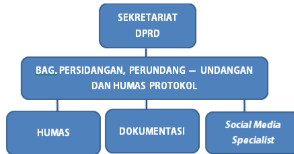
Gambar 2.3 Struktur Divisi Humas Protokol