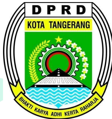
Gambar 2.1 Logo DPRD Kota Tangerang