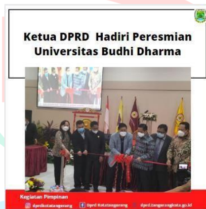
Gambar 3.4 Template Kegiatan Pimpinan

Template Instagram Post Pimpinan DPRD berasal dari Fraksi PDIP, dan template Instagram Post Kegiatan Pimpinan memiliki warna merah yang mengambil dari warna fraksi yang ada di DPRD Kota Tangerang salah satunya adalah PDIP faksi dengan latar belakang merah, serta menambahkan foto dan judul agar penonton dapat dengan mudah melihatnya. Selain itu, akun resmi Dewan Perwakilan Rakyat Daerah Kota Tangerang seperti Instagram