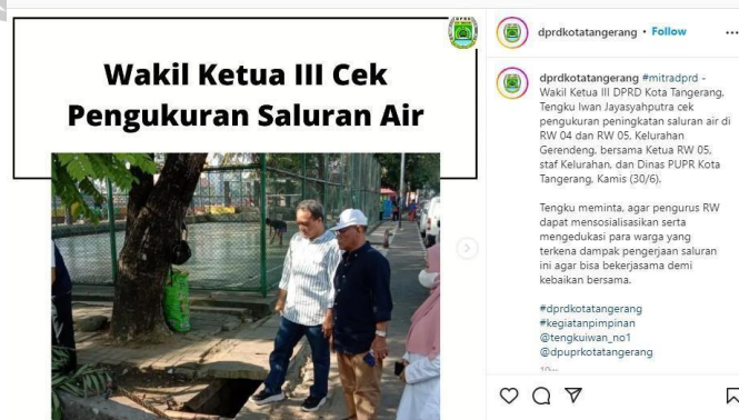
Gambar 3.1 Caption Kegiatan Pimpinan

Mahasiswa praktikan berkesempatan untuk menuliskan beberapa caption untuk konten akun Instagram @dprdkotatangerang selama masa Kerja Sehingga mahasiswa mendapatkan pengalaman yang cukup dalam menuliskan caption konten Instagram resmi DPRD Kota Tangerang. Sebelum memulai menuliskan caption , mahasiswa praktikan diminta oleh pembimbing terlebih dahulu melihat contoh – contoh caption yang sudah dibuat sebelumnya pada akun instagram @dprdkotatangerang sehingga mendapatkan gambaran bagaimana tipe atau gaya penulisan untuk akun tersebut.