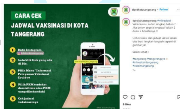
Gambar 3.2 caption Informasi

Pada caption Informasi ini membahas mengenai Informasi dari berbagai bidang pemerintahan di daerah kota tangerang, Dalam penulisan captionnya , Carak Cek Jadwal Vaksinasi di Kota Tangerang dengan menginginkan gaya penulisan yang santai tetapi tetap menggunakan kalimat-kalimat sesuai dengan EYD. Selain itu, mereka menginginkan selalu ada called to action pada setiap caption yakni untuk mengajak langsung para pengikutnya mengunjungi instagram @dprdkotatangerang.