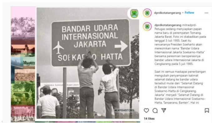
Gambar 3.3 caption Historis