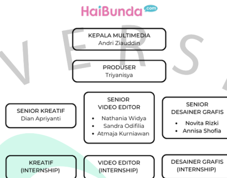
Gambar 2.3 : Struktur Divisi Multimedia HaiBunda.com