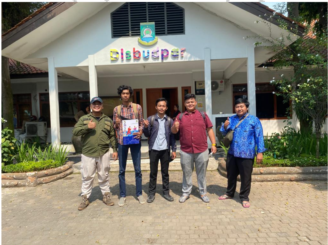
Gambar 1.2 : Praktikan Bersama rekan kerja

Dalam melakukan Kerja Profesi, Praktikan memilih untuk melaksanakannya di DISBUDPAR, Mekarsari, Kota Tangerang, Banten. Dinas Kebudayaan dan Pariwisata Kota Tangerang merupakan salah satu instansi Pemerintahan yang bertugas memperhatikan budaya dan pariwisata khususnya di Kota Tangerang. Baik dari segi promosi, pengembangan dan perencanaan budaya dan pariwisata di Kota Tangerang.