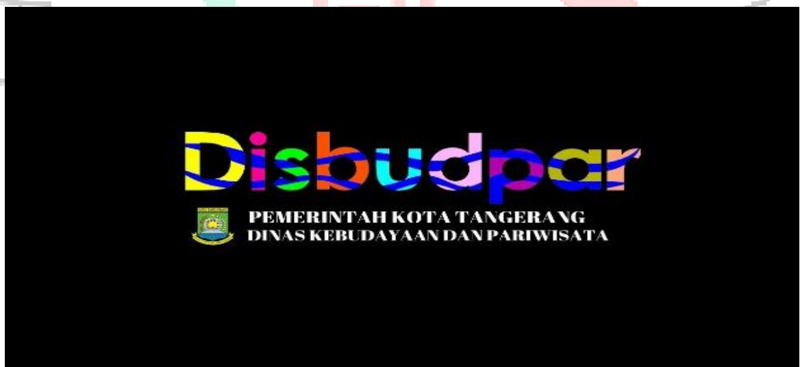
Gambar 1.1: Logo DISBUDPAR