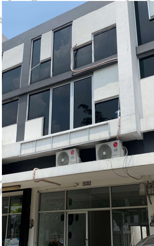
Gambar 1. 1 Perusahaan PT.BUMI REJEKI AGUN

Pelaksanaan praktek kerja profesi dilaksanakan di PT. Bumi Rejeki Agung yang bertempat di Ruko Evergreen Ecopolis U6 No.76 Citra Raya, Cikupa, Tangerang, Banten – Indonesia. Praktikan ditempatkan pada bagian System Analyst yang ditugaskan untuk membuat Tampilan desain pada aplikasi company profile untuk PT. Bumi Rejeki Agung berbasis website. Seperti dilihat pada Gambar 1.1 Perusahaan PT.BUMI REJEKI AGUNG berikut ini :