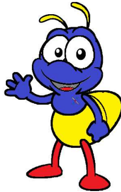
Gambar 2.3 Maskot XYZ

Maskot perusahaan retail sangat menggambarkan semangat dari perusahaan, dan berbentuk seekor semut, alasan kenapa semut dijadikan maskot karena semut adalah sosok makhluk Tuhan yang rajin, ramah dan royal serta setia kepada kawan, lingkungan, dan ratu mereka. Semut juga menggambarkan kentalnya konsep kerja sama tim guna mencapai kemajuan bersama.