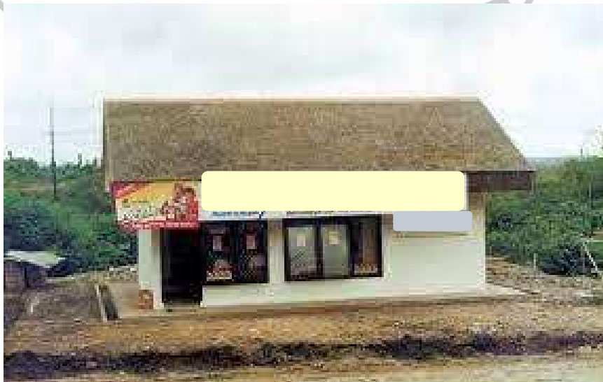
Gambar 2.1 Gerai Pertama

PT XYZ adalah sebuah perusahaan yang bergerak di bidang retail dengan mengoperasikan jaringan waralaba minimarket yang mempunyai gerai toko lebih dari 20.000 pada Agustus 2022. Konsep bisnis waralaba adalah yang pertama dan merupakan pelopor di bidang minimarket di Indonesia.