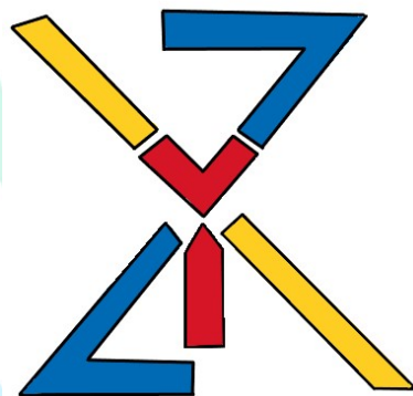
Gambar 2.2 Logo Perusahaan

Perusahaan ini mempunyai logo yang memiliki tiga warna dasar yaitu merah, biru dan kuning, dan memiliki maskot perusahaan dengan nama “Si Domar”.