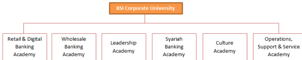
Gambar 2. 3 Struktur Organisasi BSI Corporate University

Adapun uraian tugas dari setiap Academy di BSI Corporate University yaitu sebagai berikut: