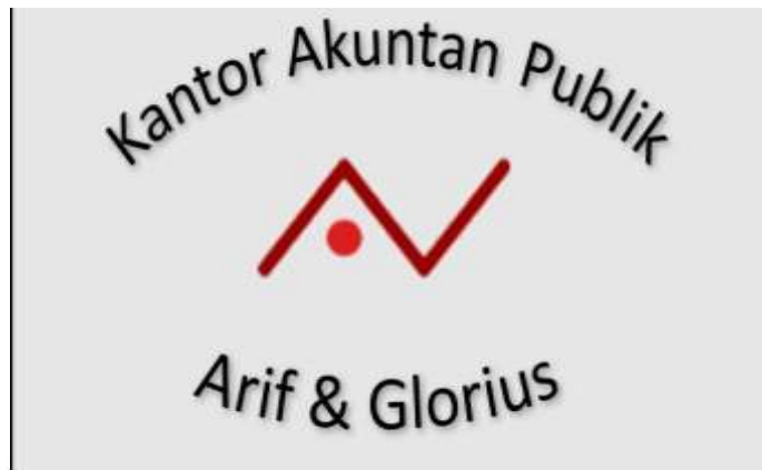
Gambar 2.1 Logo Kantor Akuntan Publik Arif & Glorius