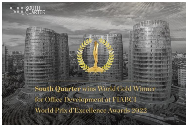
Gambar 2.2 Penghargaan FIABCI South Quarter