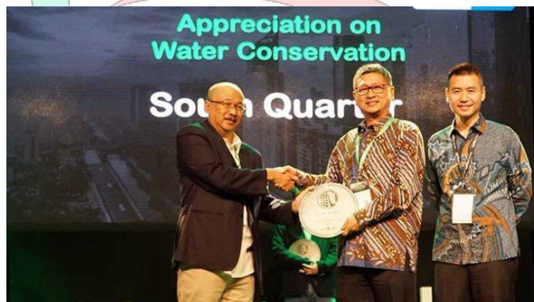
Gambar 2.3 Penghargaan South Quarter