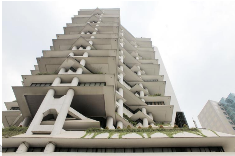
Gambar 2.8 Gedung Intiland Tower