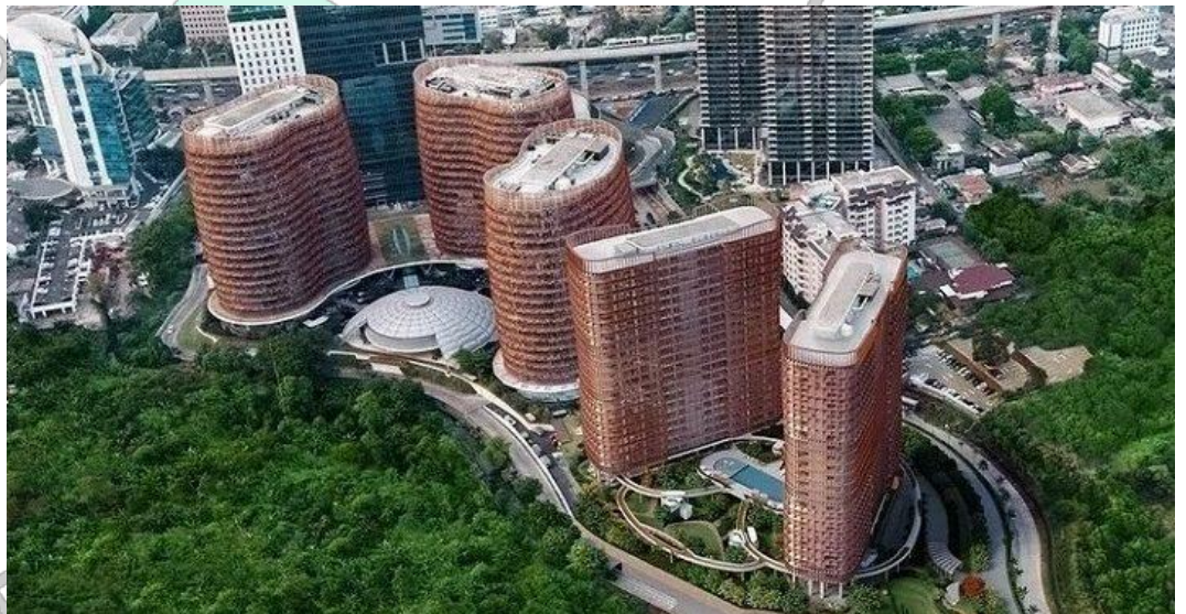
Gambar 2.5 Kawasan Perkantoran Terpadu South Quarter