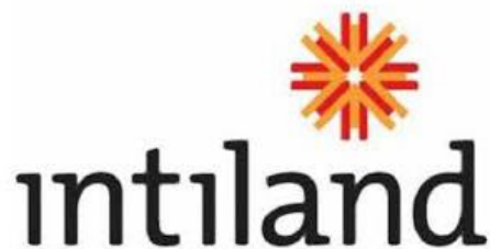
Gambar 2.1 Logo PT. Intiland Development, Tbk

PT. Intiland Development, Tbk adalah perusahaan pengembang properti unggulan di Indonesia. Dimulai dengan dua proyek yang dibangun oleh pendiri perseroan yaitu Cilandak Garden Housing yang terletak di Jakarta Selatan dan Kota Satelit Darmo di kota Surabaya. Didirikan pada tahun 1970 oleh Hendro S. Gondokusumo dengan nama awal PT. Dharmala Intiland, Tbk (DILD). Lalu pada tahun 2007 berubah nama menjadi PT. Intiland Development, Tbk karena perubahan komposisi saham. Saham perusahaan pengembang properti ini terdaftar pada Bursa Efek Indonesia pada tahun 1990.