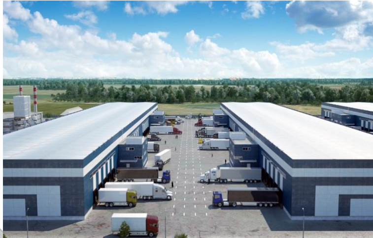
Gambar 2.7 Kawasan Industri Batang Industrial Park