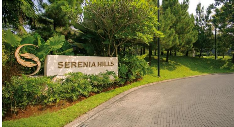
Gambar 2.6 Perumahan Serenia Hills