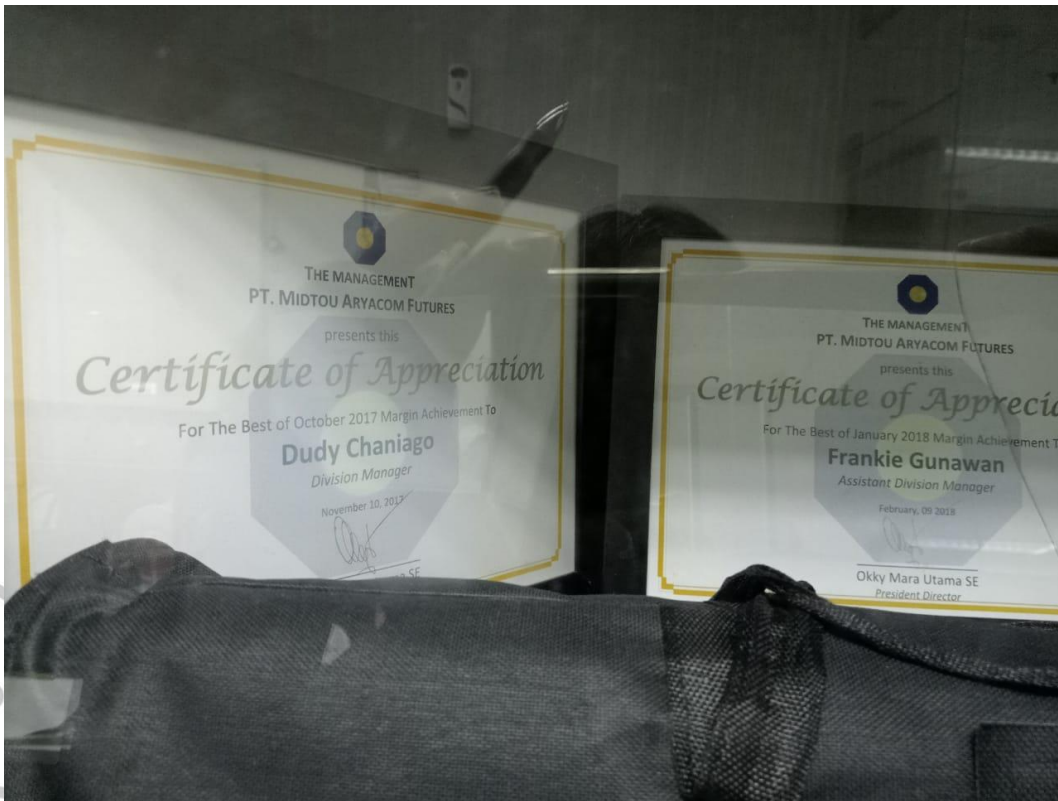
Gambar 2.2 Penghargaan Margin PT. Midtou Aryacom Futures