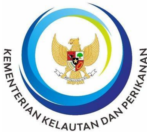
Gambar 2.2 Logo Instansi Kementerian Kelautan dan Perikanan

Bentuk lingkaran empat sulur berwarna gradasi biru dengan Lambang Negara di bagian tengah dan tulisan Kementerian Kelautan dan Perikanan di bawah dengan huruf tegas, memiliki makna kesatuan yang mencerminkan Kementerian memiliki tekad yang mengalir kuat guna mewujudkan kemakmuran masyarakat kelautan dan perikanan secara berkesinambungan demi terciptanya Indonesia maju yang berdaulat.