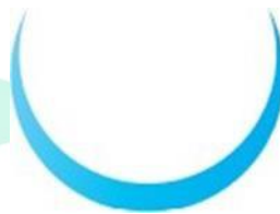
Gambar 2.5. Logo Jangkar

Jangkar yang kukuh menjaga kapal agar tidak terombang-ambing terbawa arus bisa dimaknai sebagai keteguhan hati dalam menjaga nilai-nilai keadilan dan kemanusiaan. Semua atas dasar kesetaraan, tanpa memandang perbedaan. Jangkar juga menjadi simbol kekuatan dalam menjalankan visi, misi, dan nilai-nilai Kementerian.