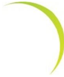
Gambar 2.7. Logo Matahari Terbit

Matahari terbit melambangkan perubahan pada seluruh elemen, dan mampu menjadikan perubahan untuk kemajuan, kesuksesan, dan pertumbuhan yang bisa menjadikan Kementerian siap bersaing demi kemajuan bangsa Indonesia. Matahari terbit juga melambangkan energi yang tidak pernah habis, begitu pula energi yang dimiliki Kementerian untuk selalu berinovasi dalam memberikan yang terbaik demi kemajuan kelautan dan perikanan Indonesia.