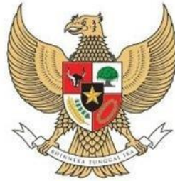
Gambar 2.4. Logo Garuda Pancasila

Lambang Negara berupa Garuda Pancasila beserta semboyan Bhinneka Tunggal Ika ditempatkan di tengah Logo melambangkan Indonesia adalah bangsa dan negara yang kuat dan berwibawa.