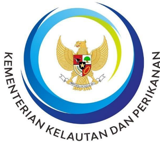
Gambar 2.1 Logo Kementerian Kelautan dan Perikanan

Sejak era reformasi bergulir di tengah percaturan politik Indonesia, sejak itu pula perubahan kehidupan mendasar berkembang di hampir seluruh kehidupan berbangsa dan bernegara. Seperti merebaknya beragam krisis yang melanda Negara Kesatuan Republik Indonesia. Salah satunya adalah berkaitan dengan Orientasi Pembangunan. Dimasa Orde Baru, orientasi pembangunan masih terkonsentrasi pada wilayah daratan. Sektor kelautan dapat dikatakan hampir tak tersentuh, meski kenyataannya sumber daya kelautan dan perikanan yang dimiliki oleh Indonesia sangat beragam, baik jenis dan potensinya. Potensi sumberdaya tersebut terdiri dari sumberdaya yang dapat diperbaharui, seperti sumberdaya perikanan, baik perikanan tangkap maupun budidaya laut dan pantai, energi non konvensional dan energi serta sumberdaya yang tidak dapat diperbaharui seperti sumberdaya minyak dan gas bumi dan berbagai jenis mineral. Selain dua jenis sumberdaya tersebut, juga terdapat berbagai macam jasalingkungan lautan yang dapat dikembangkan untuk pembangunan kelautan dan perikanan seperti pariwisata bahari, industri maritim, jasa angkutan dan sebagainya. Tentunya inilah yang mendasari Presiden Abdurrahman Wahid