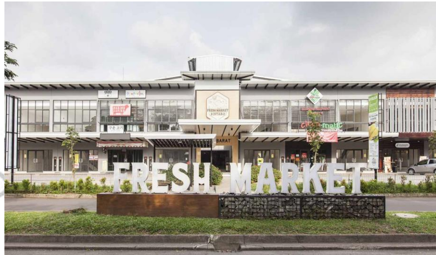
Gambar 2.1 Gedung Fresh Market Bintaro

PT Sumber Jaya Kelola Indonesia yang didirikan pada tahun 2009 merupakan sebuah perusahaan yang bidang usahanya melingkupi pengelolaan property dan pusat perbelanjaan. Perusahaan ini didirikan oleh induk perusahaan yang sama dengan induk perusahaan PT Jaya Real Property Tbk, yaitu PT Pembangunan Jaya. Oleh karena itu PT Sumber Jaya Kelola Indonesia dan PT Jaya Real Property Tbk memiliki pemegang kendali yang sama, yaitu PT Pembangunan Jaya. PT Sumber Jaya Kelola Indonesia didirikan untuk menunjang kegiatan operasional PT Jaya Real Property Tbk.