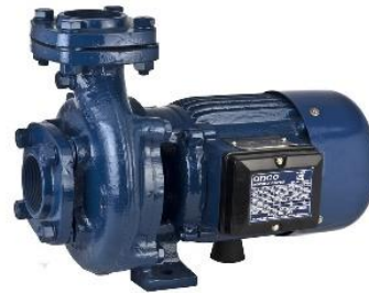
Gambar 2.9 Pompa Air