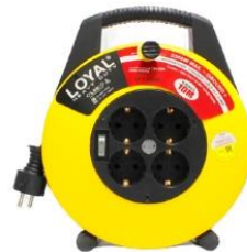
Gambar 2.7 Kabel rol