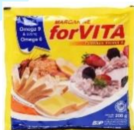
Gambar 2.5 Margarin Forvita