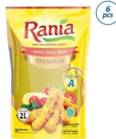
Gambar 2.17 Minyak Goreng Rania