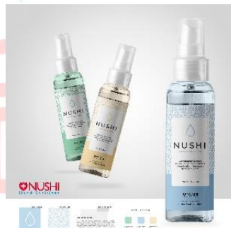
Gambar 2.15 Nushi Handsanitizer