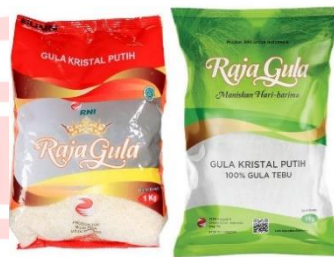
Gambar 2.18 Raja Gula