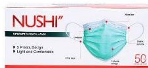
Gambar 2.13 Masker Nushi