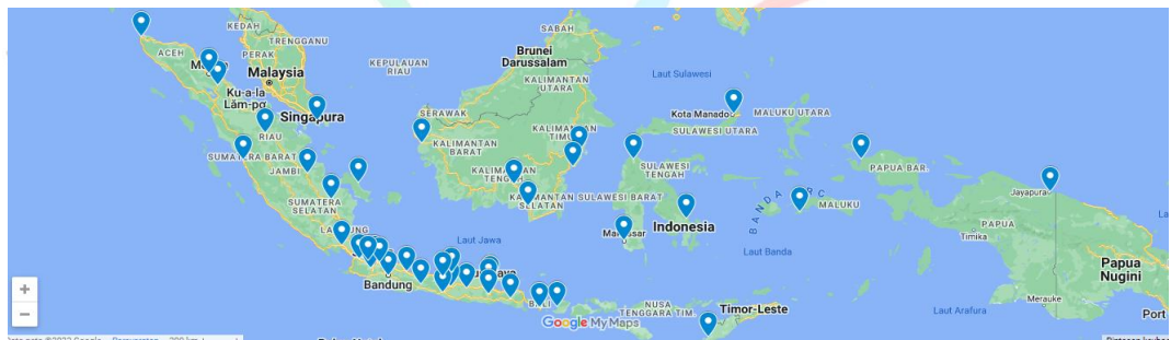
Gambar 2.19 Cabang Rajawali Nusindo

Distribusi obat-obatan, peralatan medis, dan barang-barang konsumen dari 41 prinsipal ke pasar konvensional dan kontemporer. Teknologi Sales Force Automation (SFA) mendukung daya distribusi perusahaan. Salah satu perusahaan dagang terbesar di Indonesia adalah PT Rajawali Nusindo. Rajawali Nusindo melakukan operasinya melalui 43 kantor cabang yang tersebar di seluruh Indonesia. Rajawali Nusindo adalah bisnis terbesar di Indonesia dan memiliki keunggulan dibandingkan para pesaingnya.