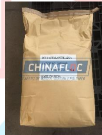
Gambar 2.12 Flocculant Anionic