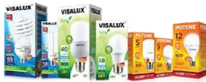
Gambar 2.8 Lampu LED

b. Produk Trading : produk yang cepat melakukan kegiatan jual beli dan memperoleh nilai keuntungan yang besar. Oleh karena itu, produk komersial biasanya memiliki keuntungan yang sangat tinggi.