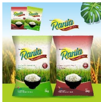
Gambar 2.16 Beras Rania