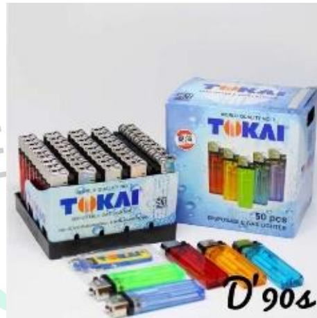
Gambar 2.6 Korek Api