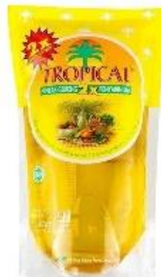
Gambar 2.4 Minyak Goreng Tropical