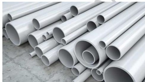
Gambar 2.10 Pipa