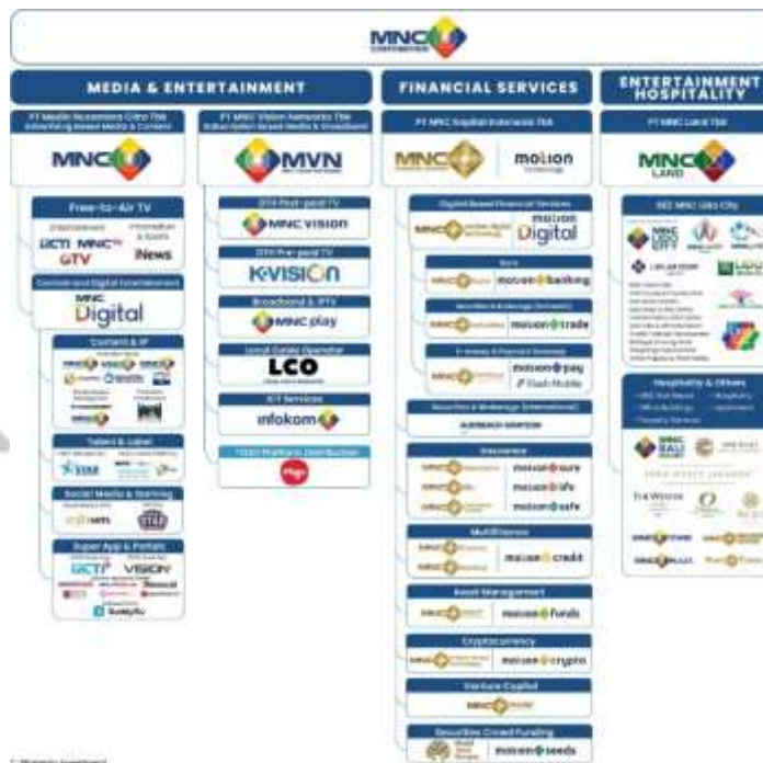
Gambar 2. 1 Struktur Perusahaan