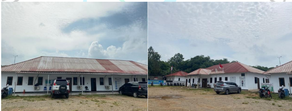
Gambar 1. 1 Direksi Keet PT. Wiranta Bhuana Raya (Proyek Tol Serpong – Balaraja)