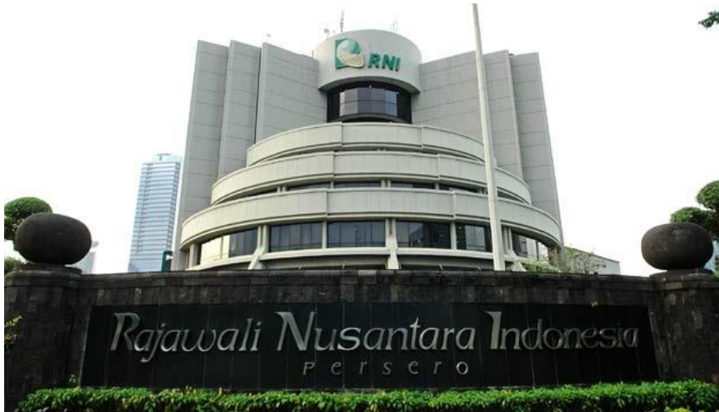
Gambar 1.1 kantor depan PT. Rajawali Nusindo