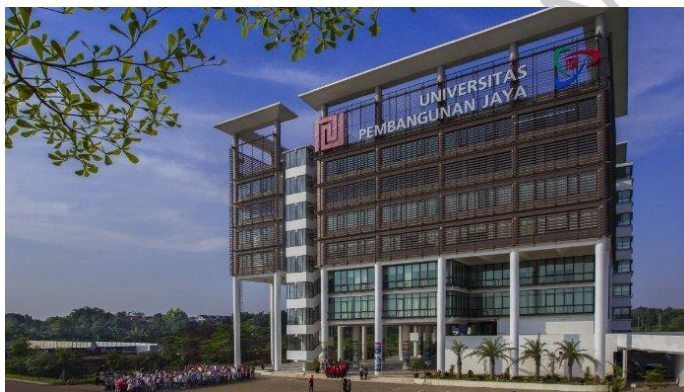
Gambar 2. 5 Proyek Pembangunan Universitas Pembangunan Jaya.