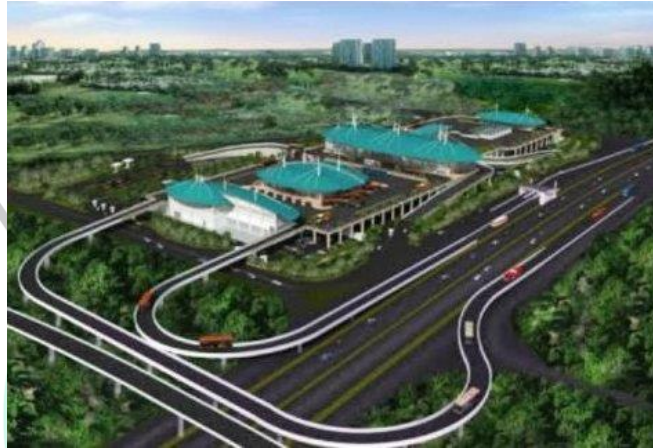
Gambar 2. 9 Proyek Pembangunan Terminal Bus Pulo Gebang.

(PT. Jaya Konstruksi Manggala Pratama, Tbk)