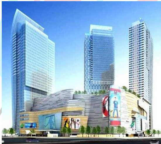
Gambar 2. 8 Proyek pembangunan Mega Proyek Ciputra World.

(PT. Jaya Konstruksi Manggala Pratama, Tbk)