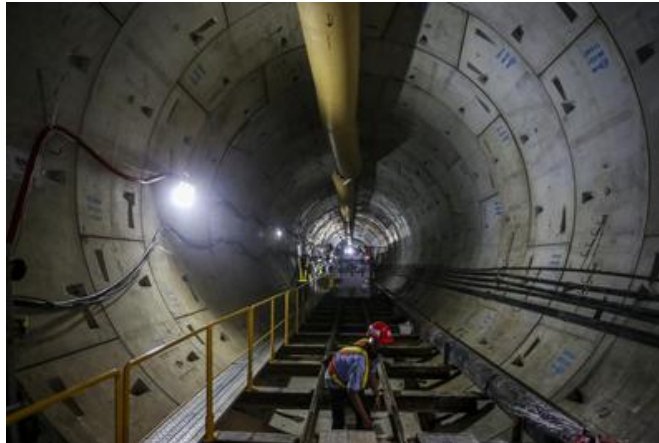
Gambar 2. 7 Proyek Pembangunan MRT.