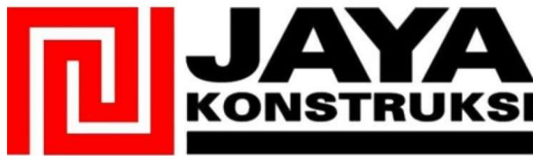
Gambar 2. 1 Logo Jaya Konstruksi Manggala Pratama, Tbk.

PT Jaya Konstruksi Manggala Pratama, Tbk. adalah sebuah perusahaan yang merupakan anggota dari Grup Jaya, perusahaan ini bergerak di bidang infrastruktur yang berintegritas dalam sisi infrastruktur dan juga konstruksi pembangunan. Perusahaan ini memiliki beberapa jenis produk dan jasa yang ditawarkan, dan juga perusahaan telah banyak melakukan pembangunan dan pengembangan perkoataan yang baik. Perusahaan berhasil mendirikan beberapa proyek yaitu seperti pembangunan jalan, jalan tol, jembatan, bandara, serta membangun hunian, bangunan komersial, dan bangunan industri.