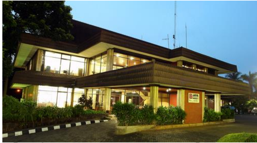
Gambar 2. 2 Kantor Jaya Konstruksi Manggala Pratama, Tbk.

(PT. Jaya Konstruksi Manggala Tbk, 2022)