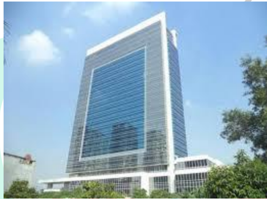
Gambar 2. 6 Proyek Puri Financial Tower .

(PT. Jaya Konstruksi Manggala Pratama, Tbk)