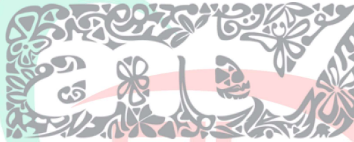
Gambar 2.1 Logo ANTV

PT Cakrawala Andalas Televisi merupakan salah satu perusahaan media di Indonesia yang bergerak di industri pertelevisian. Dengan saluran televisi yang diberi nama ANTV, berdiri sejak 1 Januari 1993. Pada awal berdirinya, ANTV merupakan stasiun televisi lokal wilayah Lampung dan sekitarnya. Dengan mengantongi izin siaran lokal, ANTV melakukan siaran selama lima jam per hari.