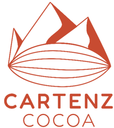
Gambar 1. 1 Logo Brand Cartenz Cocoa

Pada Juni 2021, perusahaan Persatuone melebarkan sayapnya ke kakao Indonesia. Perusahaan Persatuone mulai mengolah kakao dari beberapa daerah untuk dijadikan bubuk minuman. Pada mulanya, perusahaan memasok bubuk cokelat dengan model bisnis B2B (business to business) . Bubuk minuman cokelat single origin dari perusahaan Persatuone pun sudah dipakai oleh beberapa kafe dan digemari cukup banyak orang.