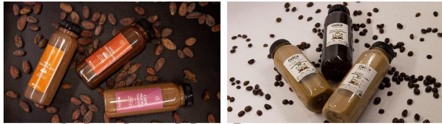
Gambar 2. 4 Produk PT. Persatuone

Produk umum yang ditawarkan berupa kopi, coklat, teh, dan saat ini sedang dalam pengembangan produk jamu dan menu nasi ayam. Pemasaran dilakukan melalui media online dan offline. Pemasaran secara digital dilakukan melalui sosial media instagram, tiktok, dan whatsapp. Kegiatan pemasaran secara langsung menggunakan spanduk, brosur kecil, dan berbagai promosi yang dijalankan. Distribusi dilakukan secara langsung kepada konsumen maupun melalui ekspedisi yang bekerja sama dengan pihak CelCo.