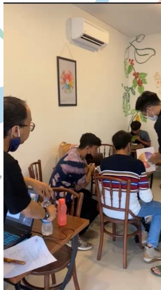
Gambar 2. 5 Rapat Bersama Tim

Produk umum yang ditawarkan berupa kopi, coklat, teh, dan saat ini sedang dalam pengembangan produk jamu dan menu nasi ayam. Pemasaran dilakukan melalui media online dan offline. Pemasaran secara digital dilakukan melalui sosial media instagram, tiktok, dan whatsapp. Kegiatan pemasaran secara langsung menggunakan spanduk, brosur kecil, dan berbagai promosi yang dijalankan. Distribusi dilakukan secara langsung kepada konsumen maupun melalui ekspedisi yang bekerja sama dengan pihak CelCo.