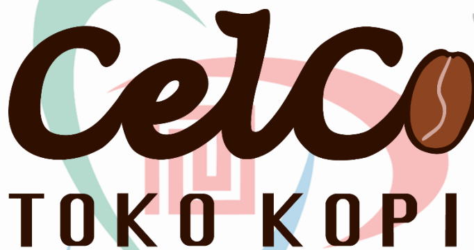
Gambar 2. 2 Logo CelCo

CelCo Toko Kopi adalah toko yang hadir sejak 18 Juni 2021 untuk menghadirkan koleksi kopi Indonesia dari Aceh sampai Papua. Bertempat di Gading Serpong, Jl. Ir Sukarno No 3, Cihuni, Kabupaten Tangerang, Banten. CelCo merupakan toko kopi yang menyediakan kopi biji, bubuk, dan minuman kopi secara bersamaan yang menampilkan keragaman kopi Indonesia. Selain itu, CelCo juga menghadirkan berbagai komoditas lainnya seperti produk minuman coklat dari 6 daerah di Indonesia, berbagai produk teh dan olahannya, serta jamu yang dikemas secara modern. CelCo mengambil bahan baku langsung dari petani, mengolahnya menjadi produk siap digunakan untuk masyarakat. CelCo juga menyediakan produk sebagai bahan baku kafe, restoran, kantor, hotel, dan UMKM lainnya.