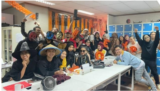
Gambar 2. 4 Perayaan Halloween Perusahaan

Setiap tahunnya Suvarna.id akan mengadakan perjalanan keluar kota bersama seluruh karyawan. Pada awal tahun 2020 lalu Suvarna.id melakukan perjalanan ke Bali karena telah mencapai target pendapatan tahunan di akhir tahun 2019. Lalu setiap tahunnya Suvarna.id juga melaksanakan kegiatan Buka Bersama pada bulan Ramadhan dan melaksanakan Halloween dengan memakai kostum-kostum saat hari kerja.