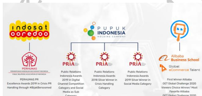
Gambar 2. 1 Penghargaan Yang Diraih Suvarna.id

Melalui keresahan-keresahan tersebut, terciptalah Suvarna.id pada tahun 2017 untuk membantu para perusahaan bersaing di pasar digital dan sama-sama membantu meningkatkan ekonomi digital di Indonesia. Suvarna.id memanfaatkan media sebagai salah satu servis yang diberikan kepada kliennya. Bagi Suvarna.id komunikasi melalui media merupakan hal yang sangat penting dilakukan para perusahaan di era disrupsi digital. Karena semua industri perlahan akan beralih menjadi digital.