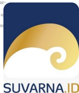
Gambar 2. 2 Logo Perusahaan

Nama Suvarna berasal dari bahasa sansekerta yang artinya emas atau keemasan. Warna emas dalam logo Suvarna melambangkan keberkahan (prosperity), pemberian warna ini diharapkan oleh perusahaan agar perusahaan mendapatkan keberkahan setiap bekerjasama dengan para klien. Sedangkan warna biru melambangkan kematangan atau stabilitas, pemberian warna ini diharapkan perusahaan agar perusahaan bisa terus berkembang dan memiliki kemajuan yang stabil dalam bersaing di era digitalisasi. Logo Suvarna.id ini diambil dari Golden Ratio yang mewakili keseimbangan yang ditemui disekitar kita.