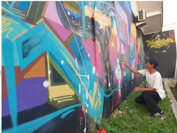
Gambar 2.8 Mural art

Kegiatan rutin yang diselenggarakan oleh kreo creative lot sendiri adalah live music , yang menggandeng para komunitas musik di sekitar kreo. Live music yang di selenggarakan setiap akhir pekan menjadi salah satu daya tarik bagi para pengunjung kreo creative lot yang datang ke beberapa tenant f&b yang berada di kawasan kreo creative lot. Kegiatan bazar 1 hari di setiap bulan juga di lakukan kreo creative lot untuk membantu para umkm di sekitar berkembang.