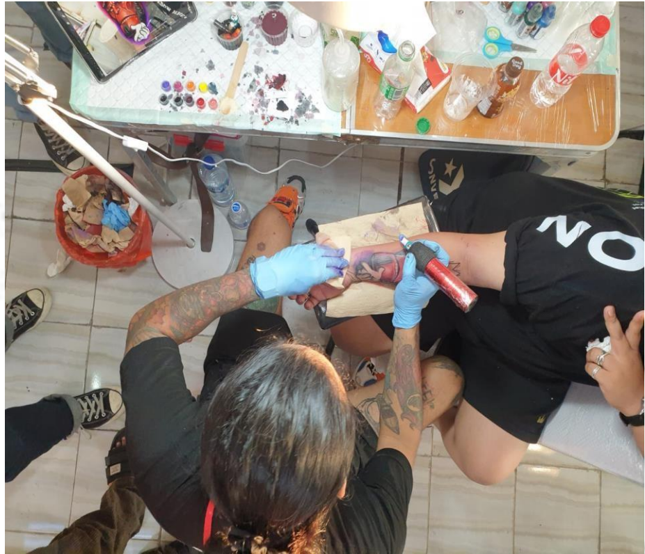
Gambar 2.7 tattoo charity