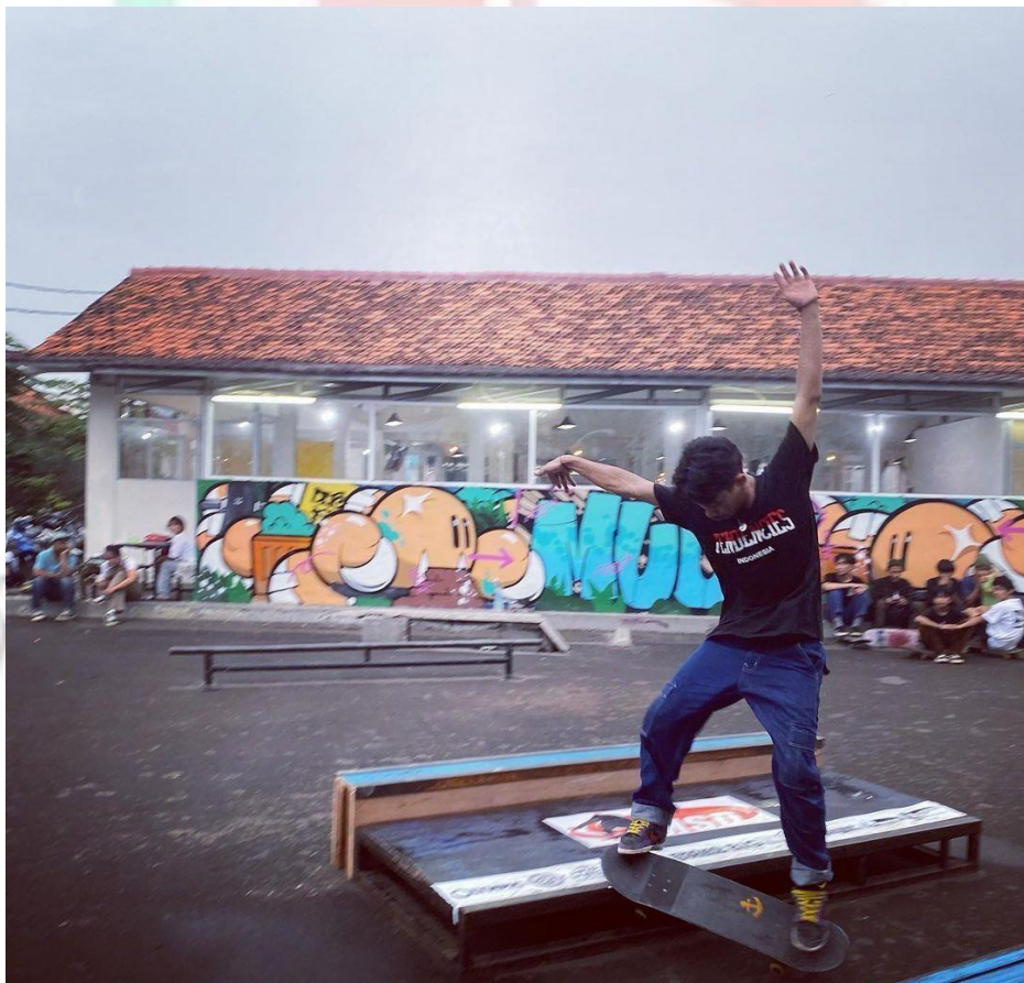
Gambar 2.6 Fun Skateboarding