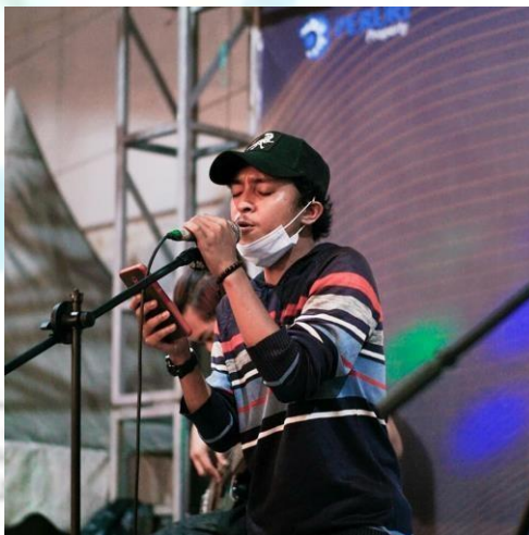
Gambar 2.9 Live music

Kegiatan rutin yang diselenggarakan oleh kreo creative lot sendiri adalah live music , yang menggandeng para komunitas musik di sekitar kreo. Live music yang di selenggarakan setiap akhir pekan menjadi salah satu daya tarik bagi para pengunjung kreo creative lot yang datang ke beberapa tenant f&b yang berada di kawasan kreo creative lot. Kegiatan bazar 1 hari di setiap bulan juga di lakukan kreo creative lot untuk membantu para umkm di sekitar berkembang.