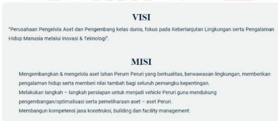
Gambar 2.3 Visi & Misi Kreo Creative Lot

Kreo Creative Lot memiliki visi dan misi yang menjadi suatu dasar dan pedoman dalam menjalankan kegiatan operasionalnya. Berikut merupakan visi dan misi Kreo Creative Lot.