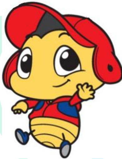
Gambar 2. 2 Maskot Perusahaan

Nama Marsyal diambil dari kata Marsmart, Si Marsyal adalah semut. Alasan kenapa semut dijadikan maskot Perusahaan, karena semut adalah sosok makhluk Tuhan yang rajin, ramah dan royal juga setia kawan, lingkungan dan ratu mereka. Semut juga menggambarkan kentalnya konsep kerjasama tim guna mencapai kemajuan bersama.