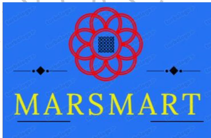
Gambar 2. 1 Logo Perusahaan

Warna Logo Perusahaan terbagi dalam 3 warna, yaitu Biru, Merah dan Kuning. Biru melambangkan Kehangatan, Kematangan, Lambang dari Ketenangan, Rendah Hati kepada pelanggan. Merah melambangkan Keberanian dalam mendobrak, sebagai Pionir. Kuning melambangkan Keceriaan & Ketulusan.