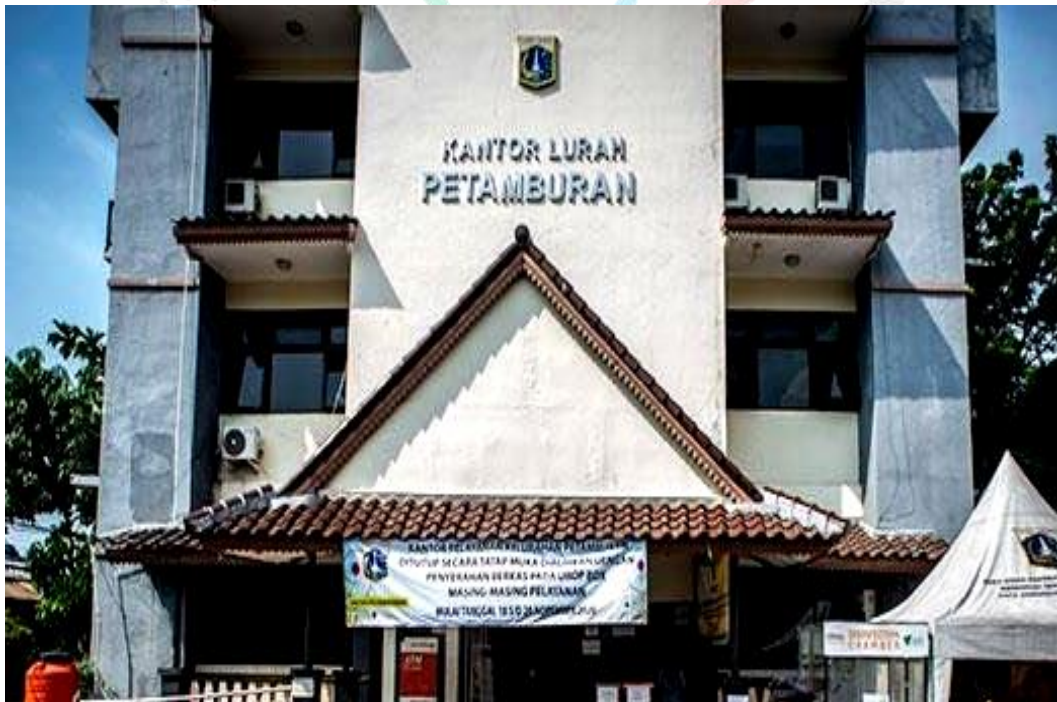
Gambar 2. 2 Kantor Lurah Petamburan - Jakarta Pusat