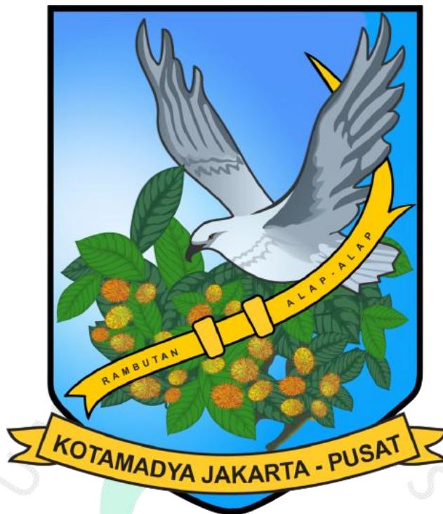
Gambar 2. 1 Lambang Kota Madya Jakarta Pusat

Kantor Kelurahan Petamburan - Jakarta Pusat mempunyai visi dan misi dalam upayanya melayani permintaan dan kebutuhan administratif dan praktik masyarakat. Berikut penjelasan lebih lengkapnya: