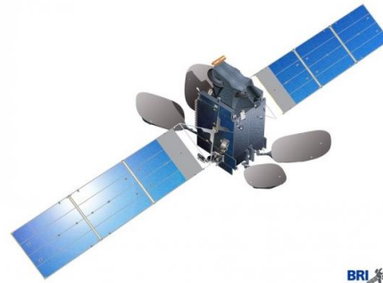
Gambar 2.1 BRIsat

Teras BRI Kapal. Meskipun Teras BRI Kapal beroperasi menggunakan kapal tetapi dilengkapi 1 unit ATM onboard yang bekerja online selama 24 jam. Kemudian, pada 2016, BRI meluncurkan satelit yang diberi nama BRIsat.