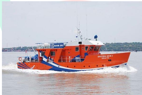
Gambar 2.2 Teras BRI Kapal