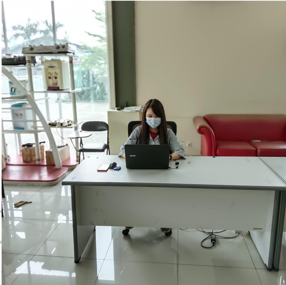
Lampiran 1.10 Praktikan Melakukan Kerja Profesi