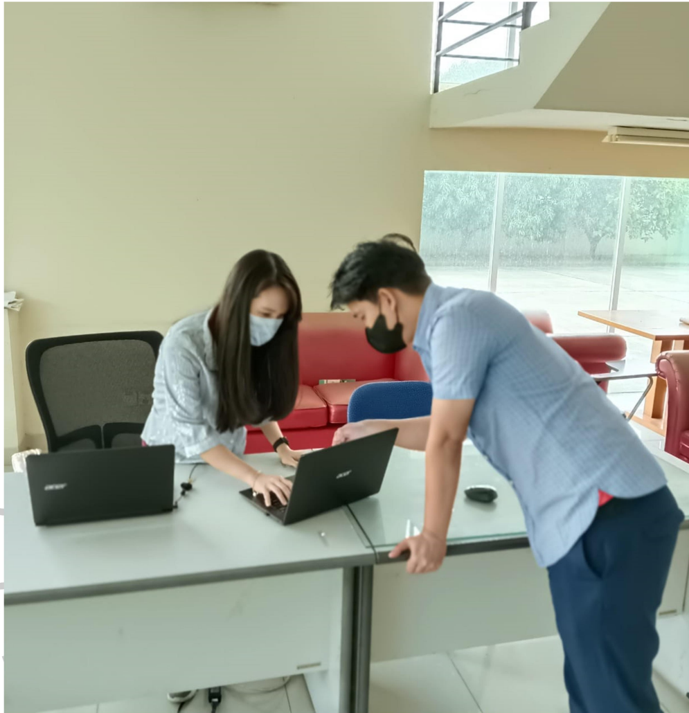
Lampiran 1.9 Praktikan Bersama Head of Finance