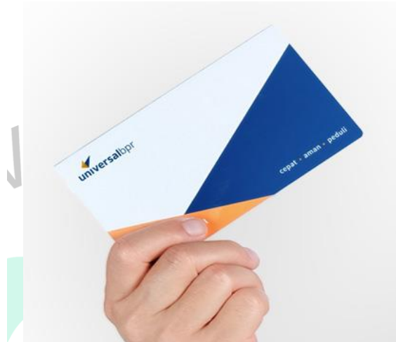
Gambar 2. 3 Tabungan Universal

Tabungan Universal merupakan Tabungan Utama dari Bank Universal BPR yang memiliki bunga tinggi serta aman di jamin oleh LPS ( Lembaga Penjamin Simpanan). Persyaratan :