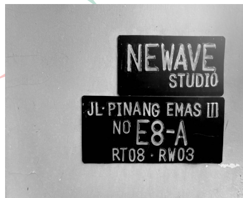
Gambar 2. 2 Alamat Perusahaan/instansi

Spesialisasi; pasca produksi, animasi, grafik gerak, produksi video, efek visual, grafik, mengedit, komposisi, pengembangan kreatif, dan proyek manajemen.