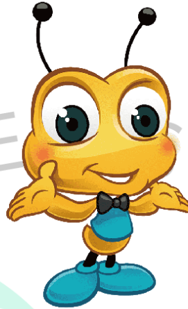
Gambar 2.1 Maskot Toko. Doremi

Di bawah ini adalah gambar maskot Toko. Doremi.