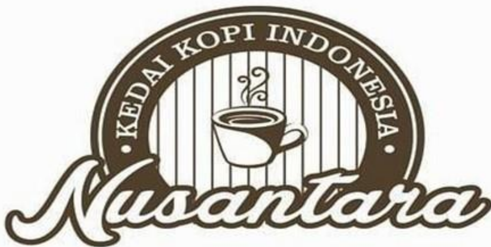
Gambar 2. 2 Logo Kopi Nusantara

Konsep bisnis ini merupakan yang pertama dan di bidang convenience store di Indonesia. Respon dari masyarakat Indonesia cukup positif, yang terlihat dari peningkatan jumlah franchisee secara berkala. Konsep bisnis franchise perusahaan juga diakui oleh jajaran direksi dengan penghargaan "2003 Superior Franchise Company". Penghargaan semacam ini merupakan yang pertama kali diterima oleh perusahaan convenience store di Indonesia dan sejauh ini baru satu kali.