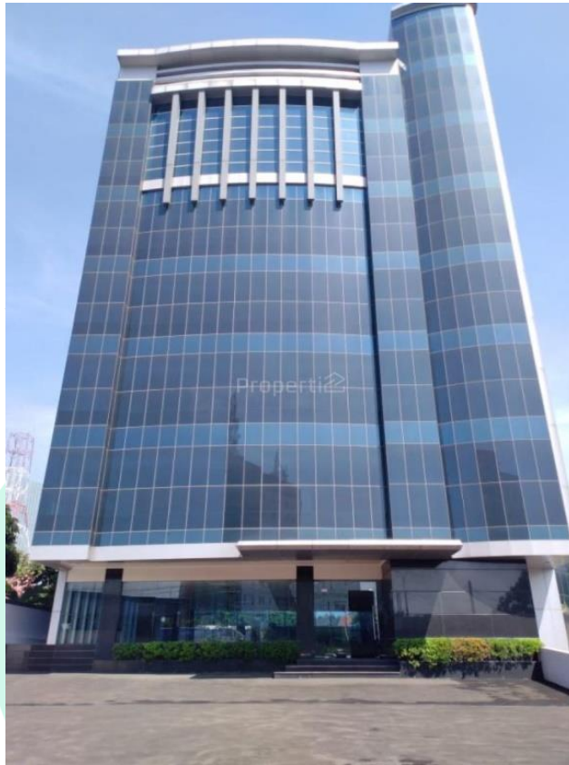
Gambar 2. 1 Kantor PT. XYZ